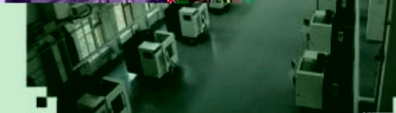
DMG 数控技术训练场所