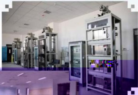
智能电梯安装调试维护训练场所