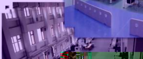
商贸管理类专业综合训练场所